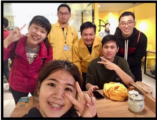
健身完去買小野豆漿喝