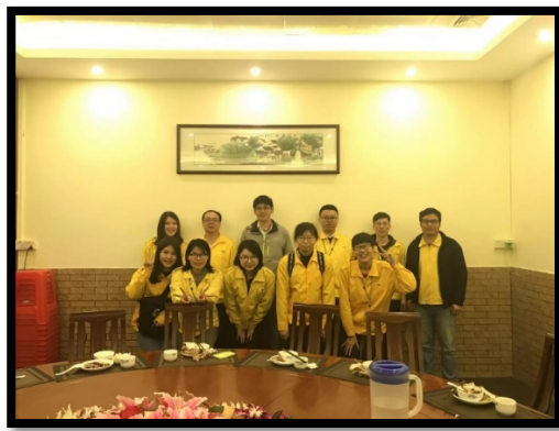
IDD 部門主管請大家吃飯