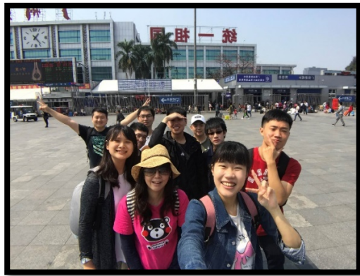
清明連假 實習生廣州遊