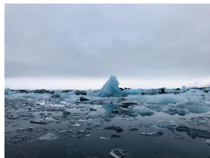
冰島-傑谷沙龍冰河湖