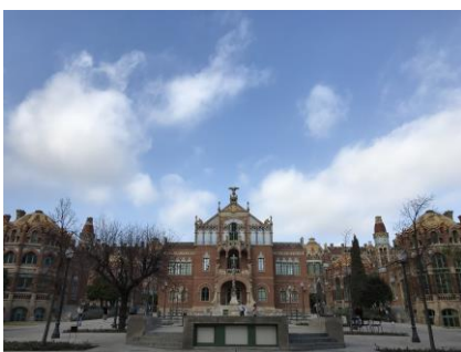
巴塞隆納-聖保羅醫院