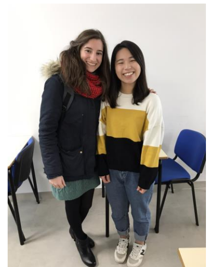
(與口說課老師合照)

哈恩大學對於交換生修課沒有太多限制，學生可依照自己的興趣修習課程。西文的部分有六個等級(A1、A2、B1、B2、C1、C2)，哈恩大學將每個等級再細分(A1.1、A1.2、A2.1、A2.2...)以此類推的正規課程，另外還有口說、寫作、文法課以及 DELE 準備班，提供學生從多方面學習西文。於學期初會有一個能力測驗分班，依照學生的程度進行分班。