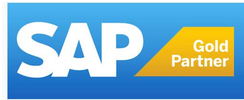
SAP 軟體 LOGE

大綜電腦系統股份有限公司於 1991 年創立，2018 年 5 月正式掛牌上櫃。大綜是台灣南部第一家的專業全方位電腦系統整合服務公司。大綜電腦負責的業務範圍甚廣，從硬體設備到軟體經銷商 Windows、Apple 等都是負責的業務範圍。我所在的部門是大綜電腦的第五事業群企業軟體暨顧問諮詢部，主要負責幫客戶公司導入 SAP 及 SALESFORCE 兩個系統。